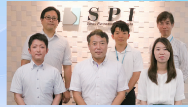
新規モダリティ支援グループのみなさん

近年、医薬品業界ではさまざまなモダリティが登場している。住商ファーマインターナショナル株式会社（以下、住商ファーマ）では、そうした新規モダリティに対し、さらなるサービス拡充のため、2023年6月に「新規モダリティ支援グループ」を編成した。同グループが提供するCMO受託製造サービスについて話を聞いた。